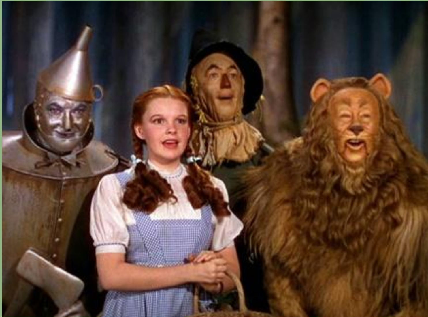
The Wizard of Oz (1939), Metro-Goldwyn Mayer