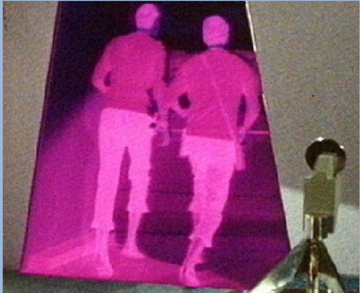
Star Trek-The Original Series (1966-1969), Paramount Pictures

Geschichte und Literatur mit neuen Medien / neuen Technologien zusammenbringen