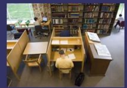
Hayden Reading Room Renovation